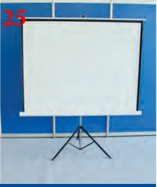
25 Проекционный экран