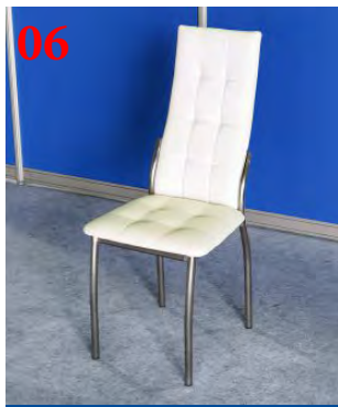
06 Стул кожаный белый