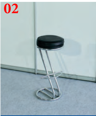
02 Стул барный