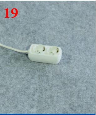
19 Подключение электричества (220 В) max до 5 кВт