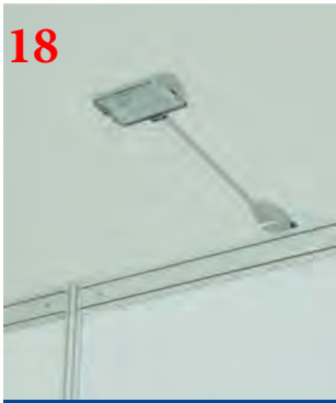
18 Светильник выносной