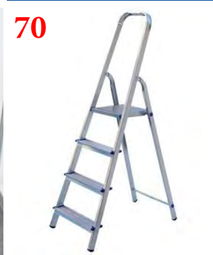
70 Аренда стремянки