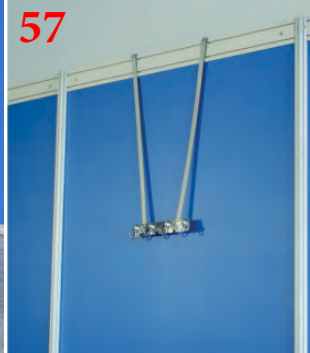
57 Вешалка настенная