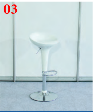
03 Стул барный «Люкс»