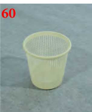
60 Корзина для бумаг