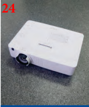
24 Мультимедиа проектор