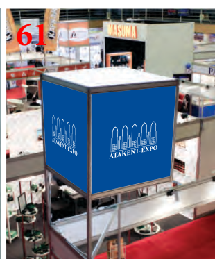
61 Куб с подсветом