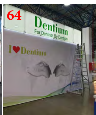
64 Печать на баннере BlockOut