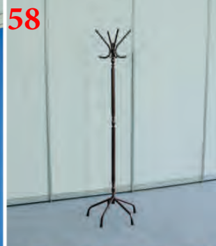
58 Вешалка напольная