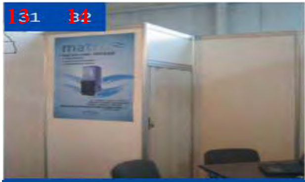
13 Журнальный столик стеклянный (50x100x75 см)