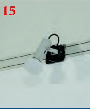
15 Светильник спот-бра