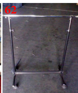
62 Мобильная вешалка