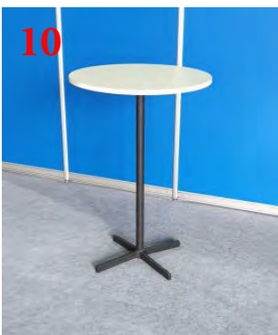
10 Стол буфетный (d 70 см)