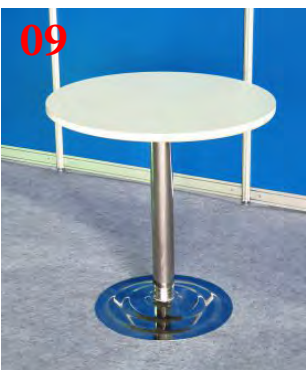
09 Стол круглый (d 70 см)