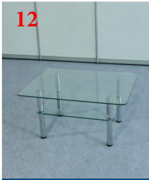
12 Журнальный столик стеклянный (50x100x75 см)