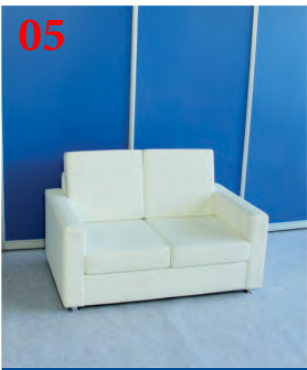
05 Диван двухместный (белый)