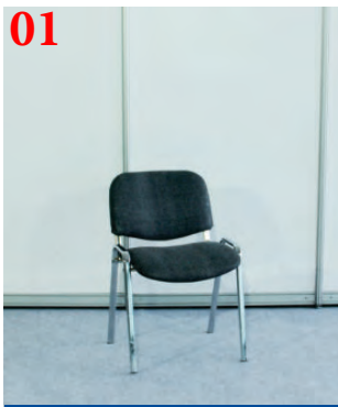
01 Стул мягкий