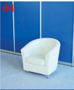
04 Кресло (белое)