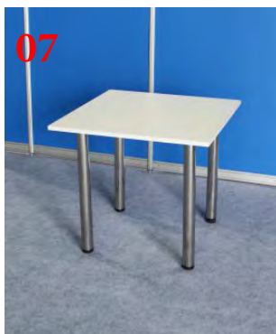
07 Стол верзальный (80x80 см)