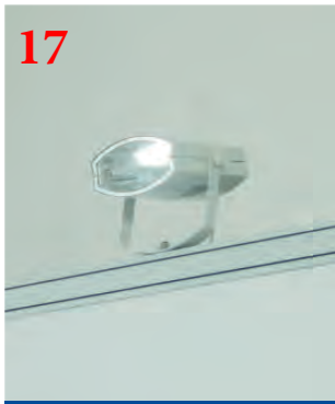
17 Прожектор металлогалогенный (белый свет)