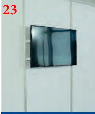
23 LED телевизор (40")