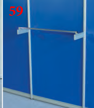
59 Вешала из профиля