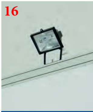
16 Светильник галогенный