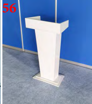
56 Трибуна для спикера