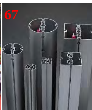
67 Аренда выставочной конструкции Maxima