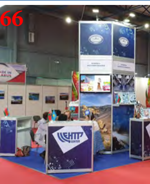
66 Полноцветная печать на виниле с монтажом