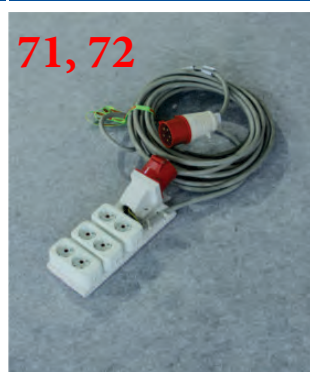
71, 72 Подключение электричества (380 В) max до 20 кВт

Просим предоставить Логотип компании в CorelDraw или в хорошем PDF. TIF. файле на e-mail: greenhouses.kz@mail.ru