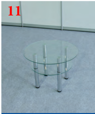
11 Журнальный столик стеклянный (d 70 см)