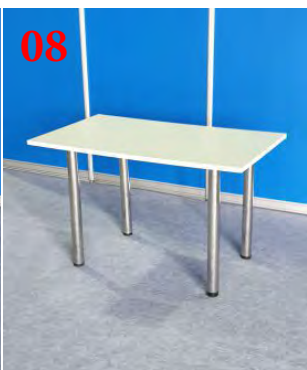
08 Стол (70x120 см)