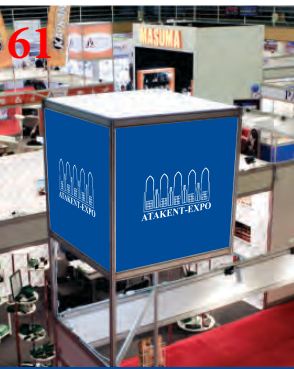
Куб с подсветкой