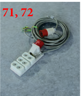
Подключение электричества (380 В) max до 20 кВт

Просим предоставить Логотип компании в CorelDraw или в хорошем PDF. TIF. файле на e-mail: greenhouses.kz@mail.ru