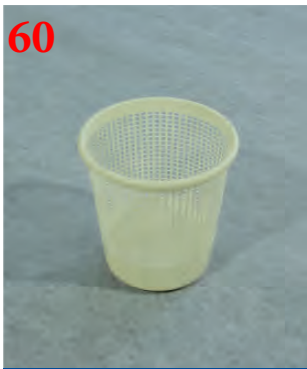
Корзина для бумаг