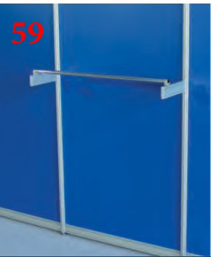
Вешала из профиля