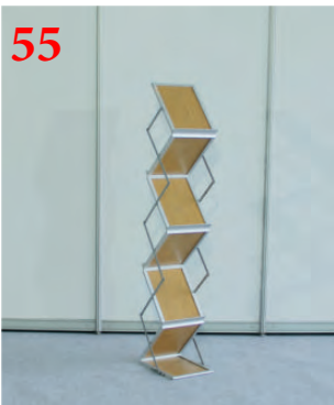
Стойка для литературы напольная (гармошка)