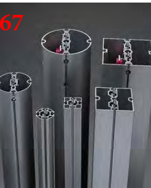
Аренда выставочной конструкции Maxima