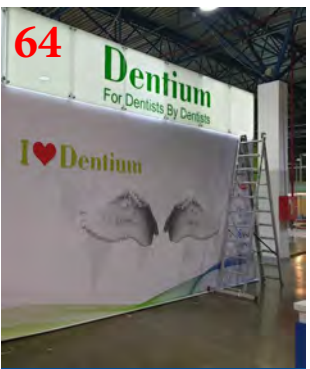
Печать на баннере BlockOut