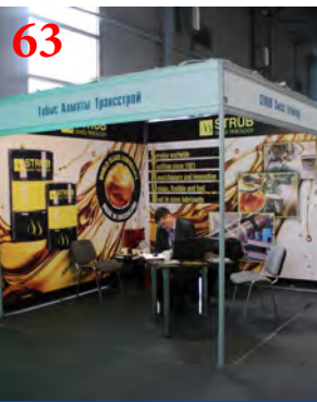
Печать на баннере