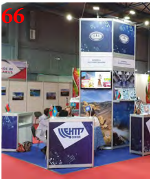
Полноцветная печать на виниле с монтажом