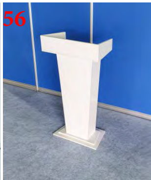
Трибуна для спикера